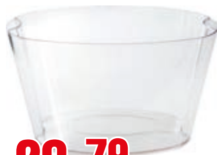
SECCHIELLO ACRILICO 9 BOTTIGLIE