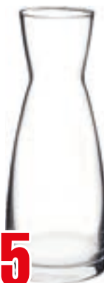
CARAFFA YPSILON LT 0,5