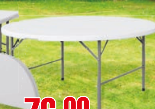
TAVOLO TONDO PIEGHEVOLE CM 154X74