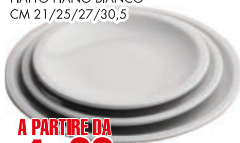
PIATTO OVALE BIANCO CM 33/ PIATTO FONDO BIANCO CM 22,5/ PIATTO PIANO BIANCO CM 21/25/27/30,5