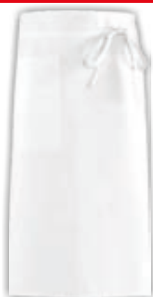
GREMBIULE TORONTO UNISEX BIANCO