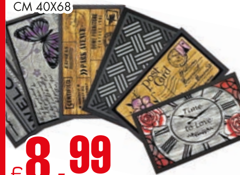
TAPPETO GARDEN FORMA CM 40X68