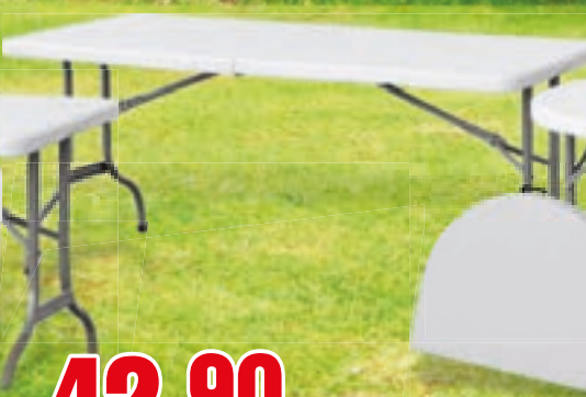
TAVOLO RETTANGOLARE PIEGHEVOLE CM 182X74