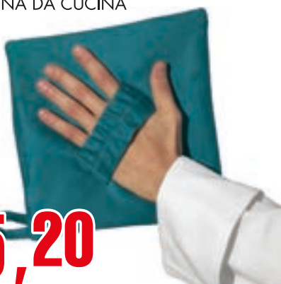
PRESONA DA CUCINA VERDE