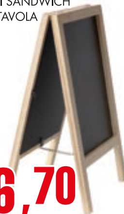
MINI SANDWICH DA TAVOLA