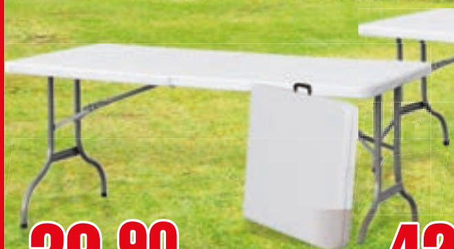
TAVOLO RETTANGOLARE PIEGHEVOLE CM 156X74