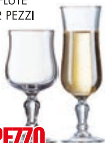
CALICE ELEGANTE ACQUA/FLUTE CONF. 12 PEZZI