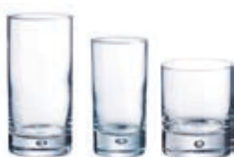
3 BICCHIERI CORTINA VINO/ACQUA/BIBITE/WHISKY