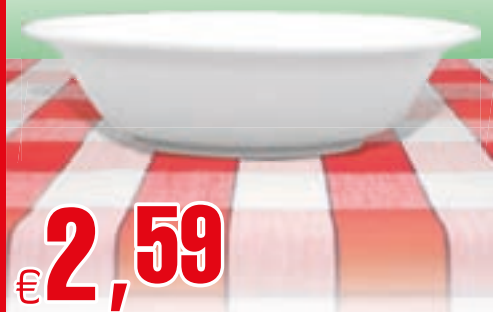
INSALATIERA BIANCA CM 18