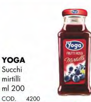
YOGA Succhi mirtilli ml 200 COD. 4200