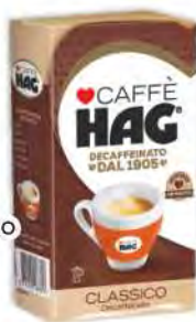
HAG Caffè classico gr 250 COD. 4102