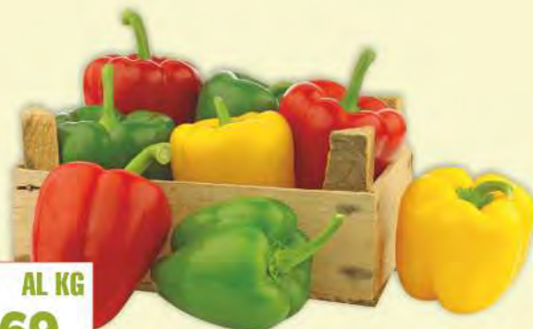
Peperoni colori misti