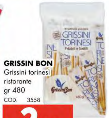
GRISSIN BON Grissini torinesi ristorante gr 480 COD. 3558