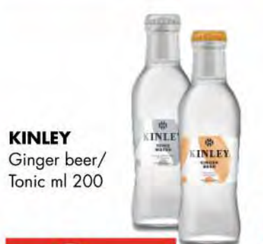
KINLEY Ginger beer/ Tonic ml 200