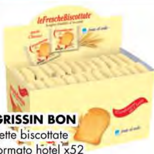
GRISSIN BON Fette biscottate formato hôtel x52 COD. 9600