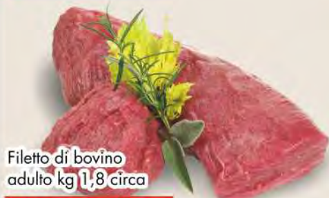
Filetto di bovino adulto kg 1,8 circa