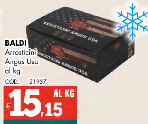
BALDI Arrosticini Angus Usa al kg COD. 21937