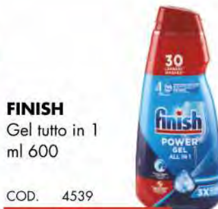
FINISH Gel tutto in 1 ml 600