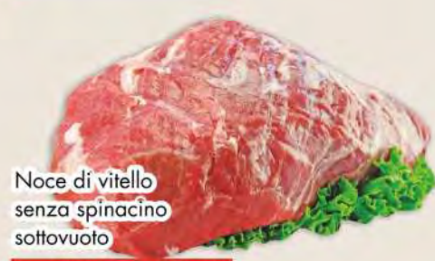
Noce di vitello senza spinacino sottovuoto