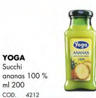
YOGA Succhi ananas 100 % ml 200 COD. 4212