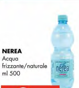
NEREA Acqua frizzante/naturale ml 500