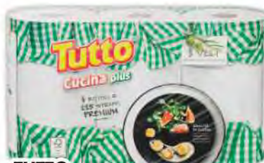
TUTTO Carta cucina plus 3 veli x 3 COD. 4057