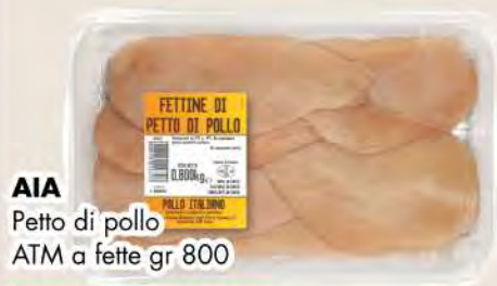
AIA Petto di pollo ATM a fette gr 800