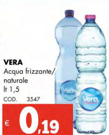
VERA Acqua frizzante/ naturale lt 1,5 COD. 3547