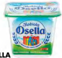
OSELLA Robiola gr 100