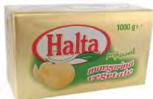
Margarina professional 80% kg 1