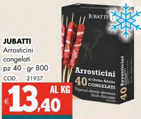
JUBATTI Arrosticini congelati pz 40 - gr 800 COD. 21937