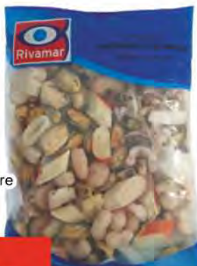
RIVAMAR Antipasto di mare surimi COD. 20615