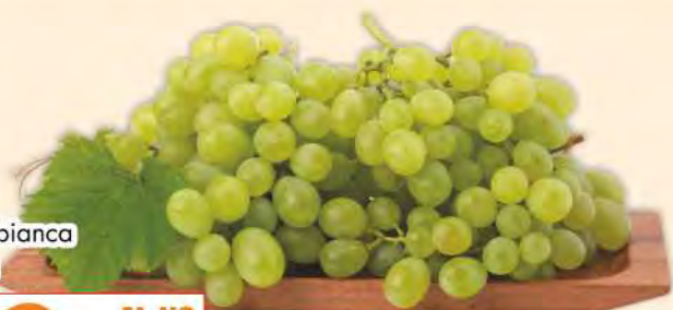
Uva bianca Italia