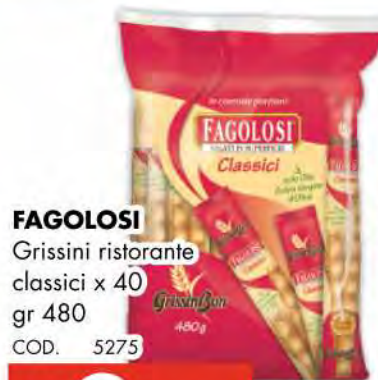
FAGOLOSI Grissini ristorante classici x 40 gr 480 COD. 5275