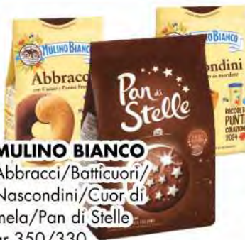
MULINO BIANCO Abbracci/Batticuori/ Nascondini/Cuor di mela/Pan di Stelle gr 350/330