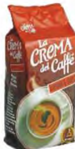
LA CREMA DEL CAFFÈ Caffè aroma gr 250 COD. 2586