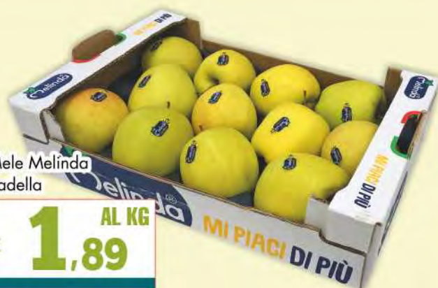
Mele Melinda padella