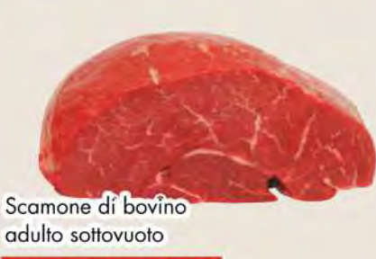
Scamone di bovino adulto sottovuoto