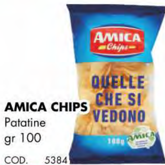
AMICA CHIPS Patine gr 100 COD. 5384