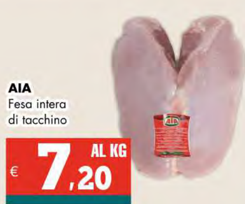
AIA Fesa intera di tacchino