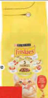
FRISKIES Crocchette gatto manzo, pollo e verdure kg 2 COD. 1058