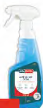
ALTASFERA Anticalcare acido fosforico ml 750 COD. 21336