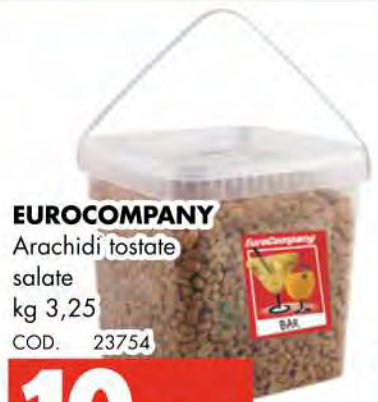
EUROCOMPANY Arachidi tostate salate kg 3,25 COD. 23754