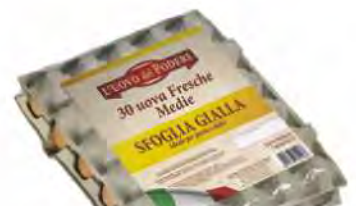
Uova podere sfoglia gialla x 30