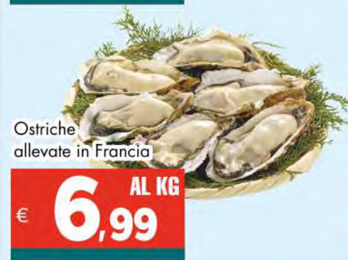
Ostriche allevate in Francia