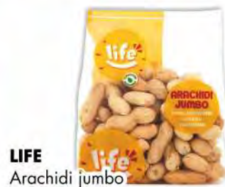
LIFE Arachidi jumbo gr 250 COD. 495