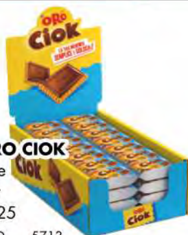
ORO CIOK latte bar gr 25 COD. 5713