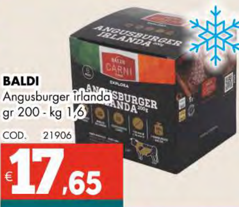
BALDI Angusburger irlandese gr 200 - kg 1,6 COD. 21906