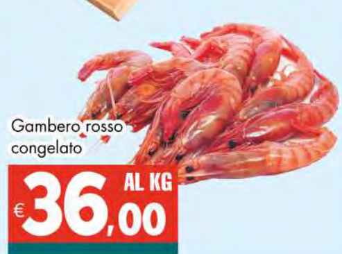
Gambero rosso congelato