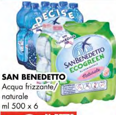
SAN BENEDETTO Acqua frizzante/ naturale ml 500 x 6