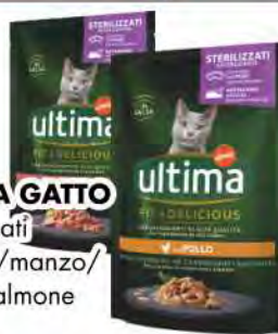
ULTIMA GATTO Sterilizzati agnello/manzo/ pollo/salmone gr 85 COD. 7861