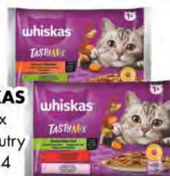
WHISKAS Tasty mix chef/coutry gr 85 x 4 COD. 9879