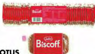
LOTUS Biscoff cortesia x 50 COD. 3353