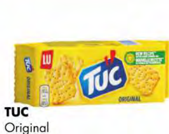
TUC Original gr 100 COD. 2579