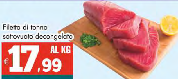
Filetto di tonno sottovuoto decongelato