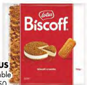
LOTUS Crumble gr 750 COD. 3364