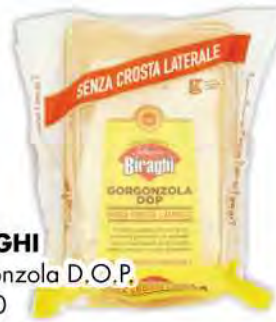
BIRAGHI Gorgonzola D.O.P. gr 200