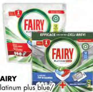
FAIRY Platinum plus blue/ lemon x 12