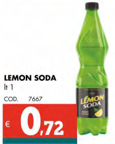
LEMON SODA lt 1 COD. 7667