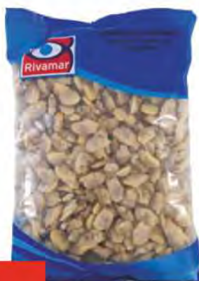
RIVAMAR Vongole veraci sgusciate COD. 20547