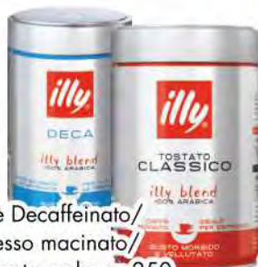
ILLY Caffè Decaffeinato/ espresso macinato/ macinato moka gr 250