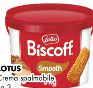
LOTUS Crema spalmabile kg 3 COD. 3366