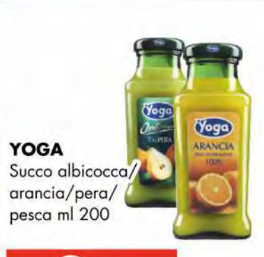
YOGA Succo albicocca/ arancia/pera/ pesca ml 200