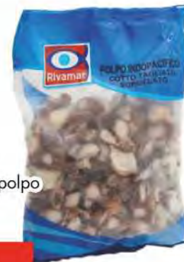
RIVAMAR Frutti di mare con polpo gr 800 COD. 25459