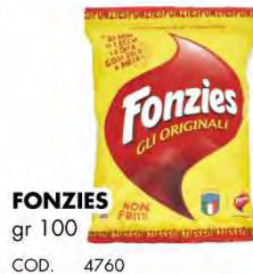
FONZIES NON FRITTI gr 100 COD. 4760