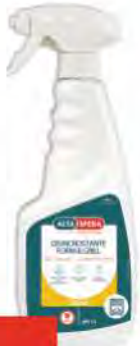
ALTASFERA Disincrostante forni e grill ml 750 COD. 21438