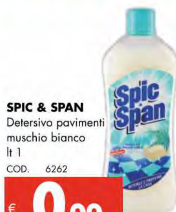
SPIC & SPAN Detersivo pavimenti muschio bianco lt 1