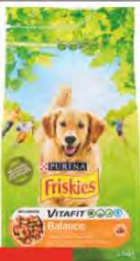
FRISKIES Croccantini cane kg 1,5 COD. 1059