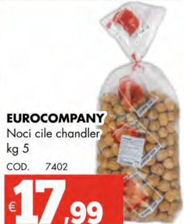
EUROCOMPANY Noci cile chandler kg 5 COD. 7402