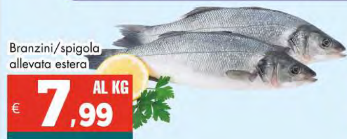
Branzini/spigola allevata estera