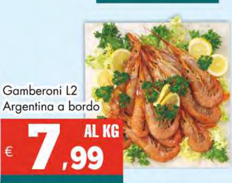
Gamberoni L2 Argentina a bordo