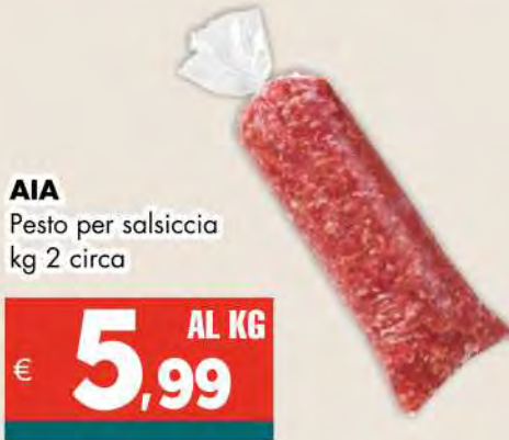
AIA Pesto per salsiccia kg 2 circa