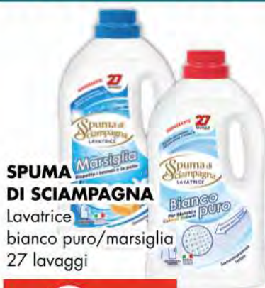
SPUMA DI SCIAMPAGNA Lavatrice bianco puro/marsiglia 27 lavaggi