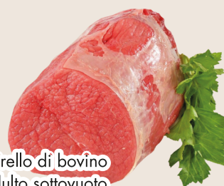
Girello di bovino adulto sottovuoto