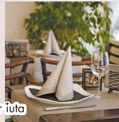
Runner juta grigio 120 x 40 x 25 COD. 25159