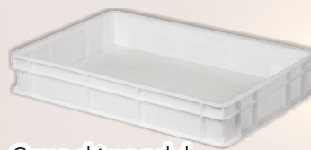
Cassa chiusa pehd lt 18 COD. 21559