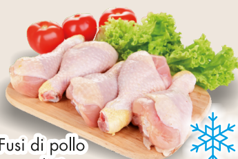
Fusi di pollo congelati