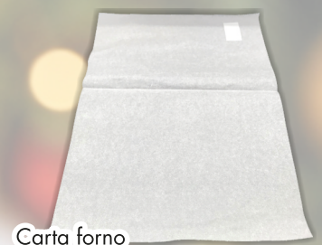
Carta forno fogli 40 x 60 x 500 COD. 20851