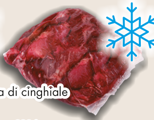
Polpa di cinghiale kg 1 COD. 8294