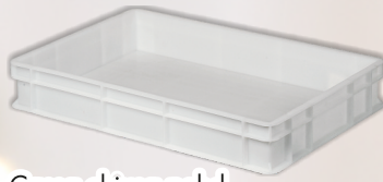
Cassa chiusa pehd lt 12 COD. 21548