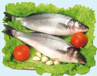
Branzino spigola allevata estera