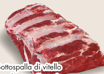
Sottospalla di vitello senz'osso sottovuoto