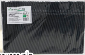
Cannucce pla nere con snodo 25 x 500 COD. 20455