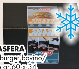
ALTASFERA Hamburger bovino/suino gr.60x34 COD. 21746