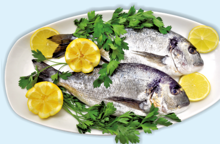
Orate estere allevate