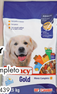
CRANCY Gold menù completo kg 7,5 COD. 4439