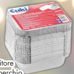
CUKI Contenitore con coperchio formati assortiti