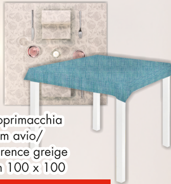
Coprimacchia flem avio/ florence greige cm 100 x 100