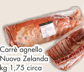
Carrè agnello Nuova Zelanda kg 1,75 circa COD. 22584