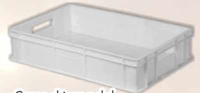
Cassa chiusa pehd lt 24 COD. 21560