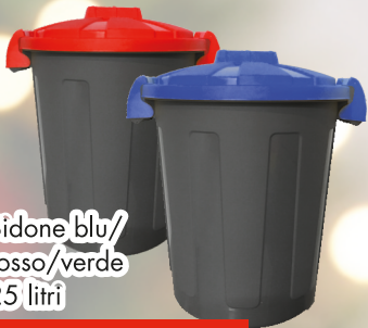
Bidone blu/ rosso/verde 25 litri