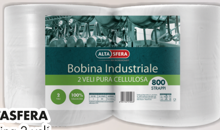
ALTASFERA Bobina 2 veli 800 strappi COD. 9404