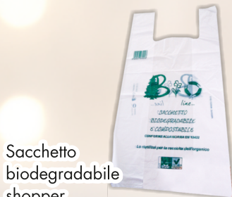
Sacchetto biodegradabile shopper cm 24 x 42 x 500 COD. 6882