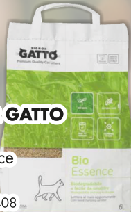
SIGNOR GATTO Lettieria Bio Essence lt 6 COD. 7408