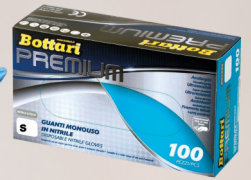
BOTTARI Guanti Monouso nitrile blu L/M/S