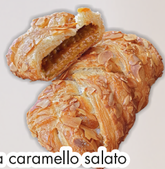
Treccia caramello salato surgelata gr 95