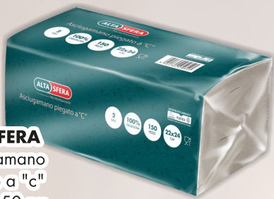
ALTASFERA Asciugamano piegato a "c" 2 veli 150 pz COD. 9708