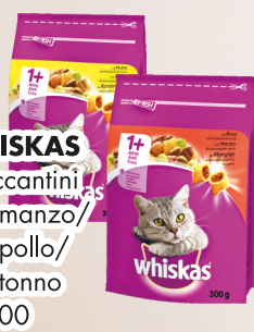
WHISKAS Croccantini con manzo/ con pollo/ con tonno gr 300