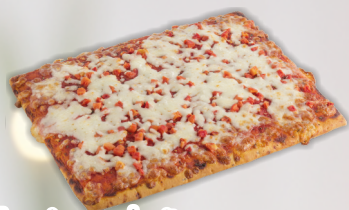
Trancio margherita surgelato gr 580