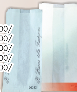
Scatola per pizza eco 32.5x32.5 COD. 22670