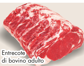
Entrecôte di bovino adulto cuore