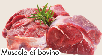
Muscolo di bovino adulto senz'osso sottovuoto