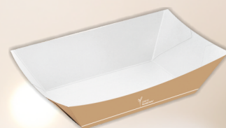
Barchetta carta 15.4 ml 400 x50 COD. 20834