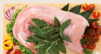
Coniglio intero congelato