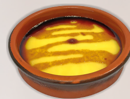
Crema catalana cocchio monoporzione pz 8