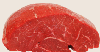
Scamone di bovino adulto sottovuoto