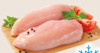
Petti di pollo congelati kg 2