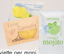
Salviette per mani mojito/limone e cannella/ tnt limone x 150