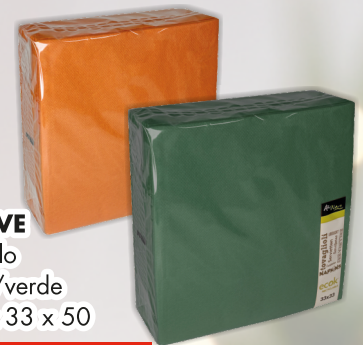
AIRWAVE Tovagliolo arancio/verde cm 33 x 33 x 50