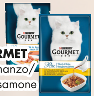
GOURMET Perle manzo/ pollo/samone gr 85