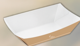
Barchetta carta cm 22 lt 1,2 x 50 COD. 20837