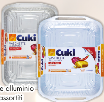
CUKI vaschette alluminio formati assortiti