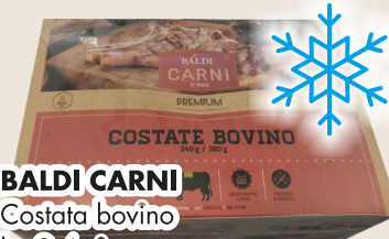
BALDI CARNI Costata bovino kg 2,4 circa COD. 22585